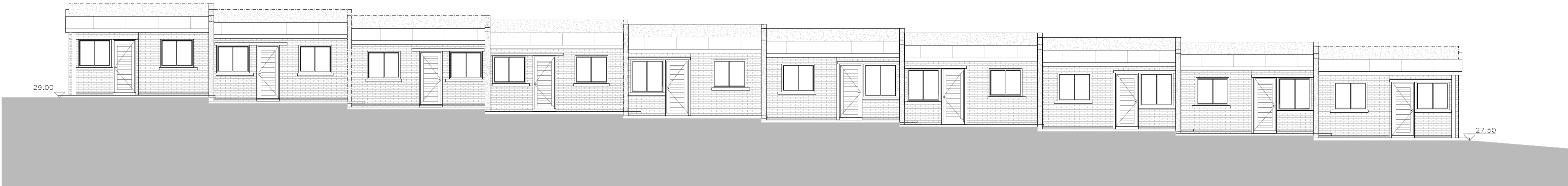
PERFIL CALLE CONGREVE escala 1/100