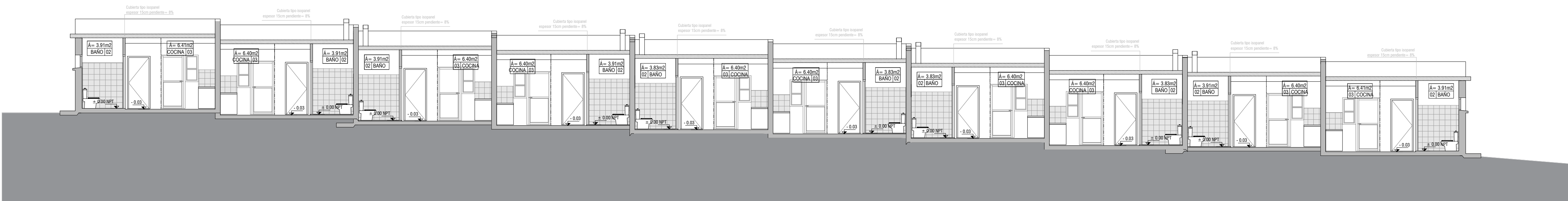
CORTE LONGITUDINAL BLOQUE A escala 1/100