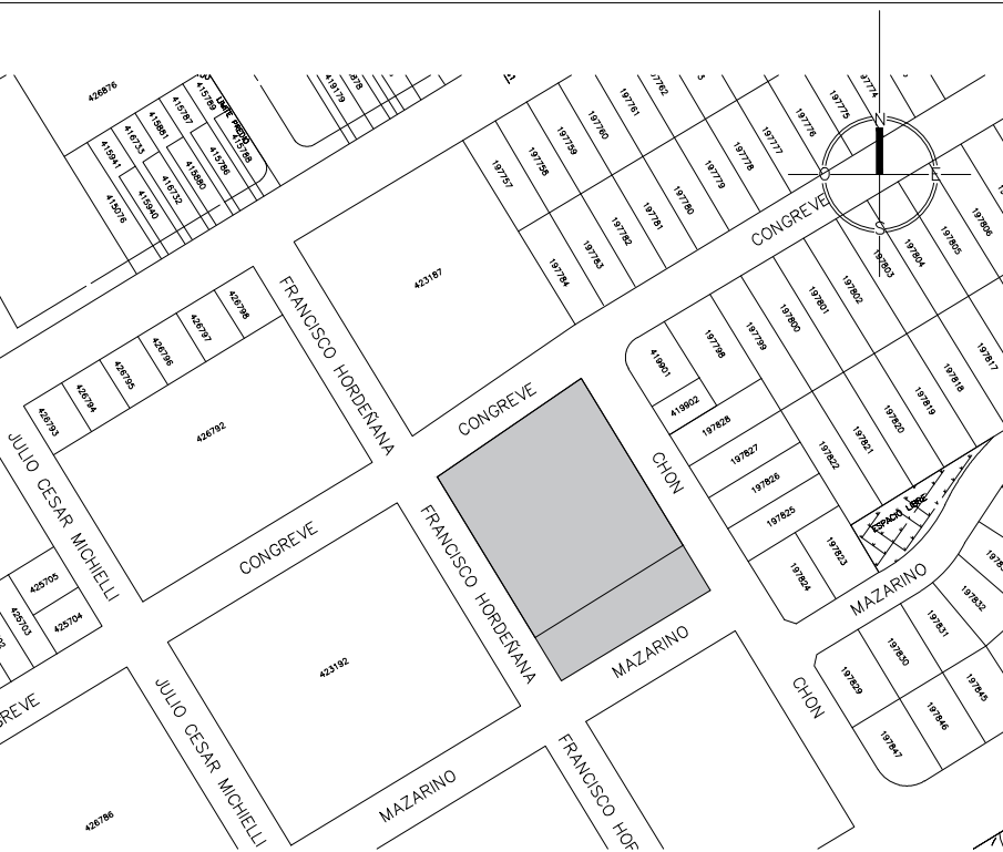
PLANO DE UBICACIÓN escala 1/1000